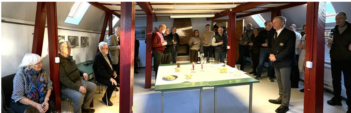
Formandens velkomst og tale

Det kan skabe overblik, fællesskab og identitet - og det har du i høj grad været med til. Du har både været den velformulerede redaktør med egne indslag og artikler, men også den aktive redaktør, der venligt - men bestemt - mindede os om deadlines. Og ja - ofte med dine egne små justeringer, vinkler og detaljer, som lige gjorde forskellen.