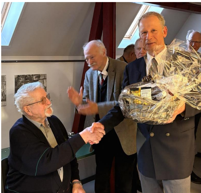
Formanden giver foreningens gave, en kurv med vin, snaps, chokolade m.m. og dertil også et meget anvendeligt bilag

Tak til jer alle sammen - tak fordi jeg har fået lov til at være med.