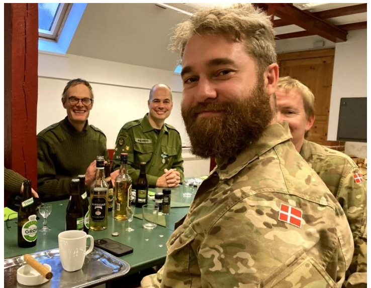
Det ene kaffe-cigar legat