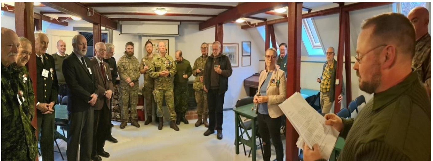
Jubilarpøtvinen - den Høje Kjæft byder velkommen