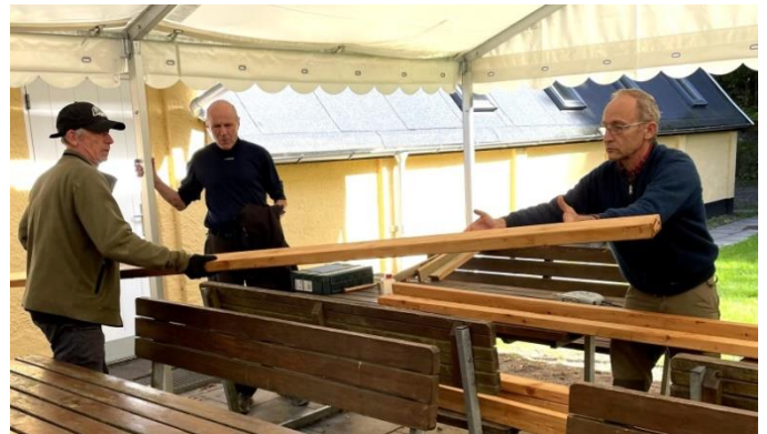
Reparation af borde/bænkesæt

Indkaldelsen gik kun til sandbjergfamilien, de medlemmer, som tidligere har ytret interesse for Bjerget, og enkelte nye medlemmer. Men til foråret vil vi nok indkalde bredere. Ofte med kort varsel da mange opgaver er vejrafhængige.