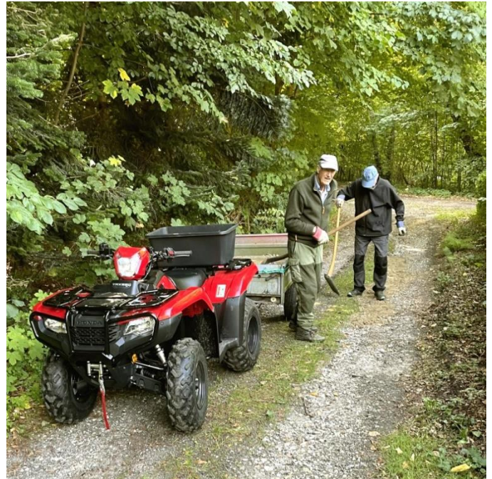
Reparation af vejen