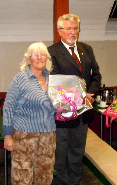
Afgående formandinde og formand under fanesangen

være ikke kunne være til stede i aften - jeg skal hilse fra dem. Tilsammen har vi tre dækket formandsposten i 41 år.