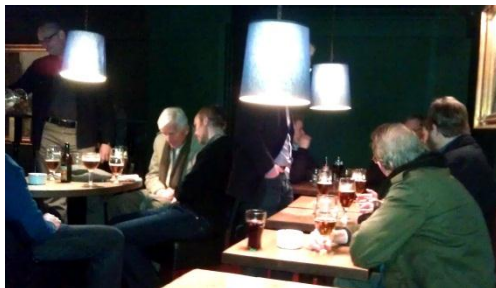
Desværre blev billederne fra aftenen ikke de mest velykkede.