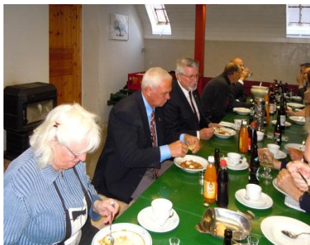
Forloren skildpade før generalforsamlingen