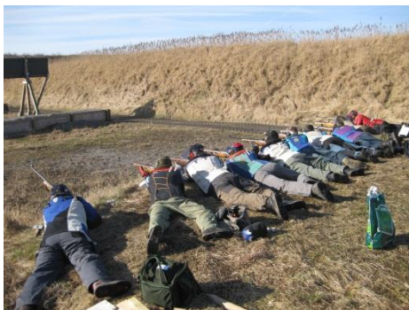
Station 2 - eneste udendørs bane