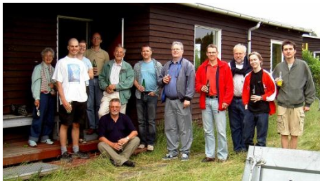
27. juni 2005 - Rydningen af Skyderhuset.

Forhandlingerne løb fra 2002 til 2004, og det var fra starten helt klart, at golfbanen skulle kompensere vores tab. Men det stod hurtigt lige så klart, at vi ikke ville kunne forvente fuld kompensation. Vi havde - lidt optimistisk ganske vist - estimeret ca. 1,5 mio. På et tidspunkt var golf-