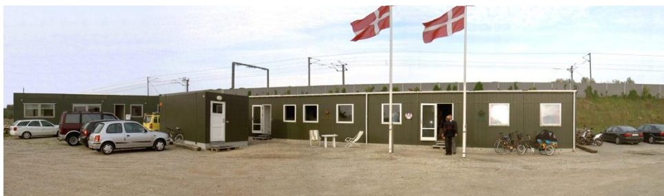
SKAK-huset på indvielsesdagen - 29. september 2006