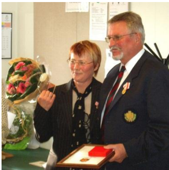
29. september 2006 - Skytternes Hæderstegn