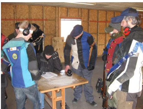
Vi venter på resultater på station 4