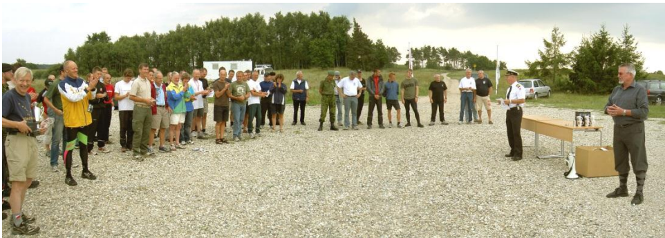
DM Feltsport - 25. august 2006 - Præmieoverrækkelse

Det er meget fint at se, at feltsporten på det seneste har fået tilgang af unge i den absolutte elite, så de igen kan vinde mesterskaber, som vi gjorde det tilbage i 70'erne og 80'erne.