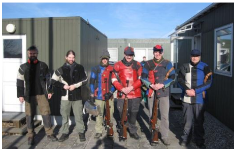
AS holdet klar til afgang

Der var denne sæson i alt 8 AS'ere, der deltog en eller flere gange: