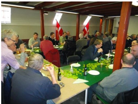
Aftenens mad inden foredragsaftenen