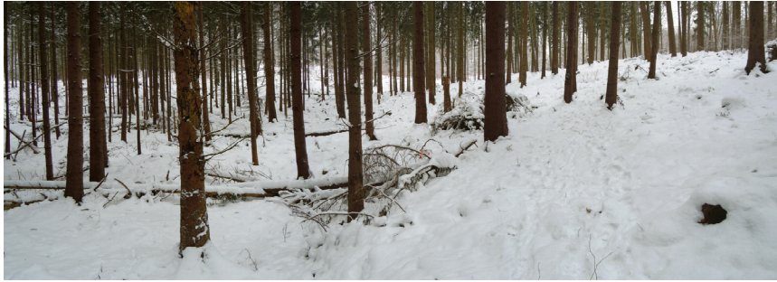
Post 14 i granskoven - godt gemt bag et snedækket væltet træ (lige midt i billedet)