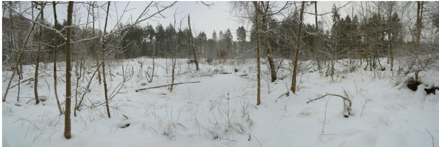
Post 8 (også lige midt i billedet) var nem at finde, men vanskelig at komme frem til. Flere 100 m. løb - som var mere gang eller kamp - i ½ m. sne, som dækkede alt - grene, huller mv. - var "ret hårdt" for nogle af os gamle.,