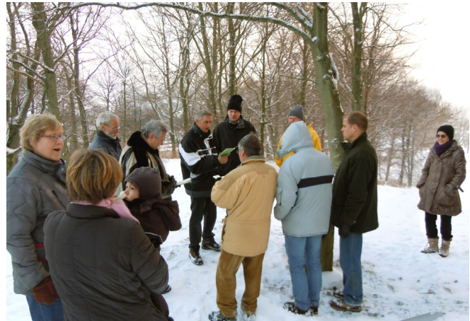
Som sædvanligt afsluttedes med sang på Toppen - med nogle af de afhentende damer - som også trodsede kulden.