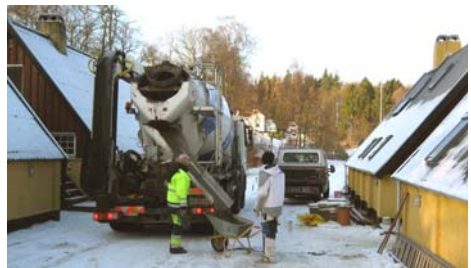
Betonkanon i Lejrgaden