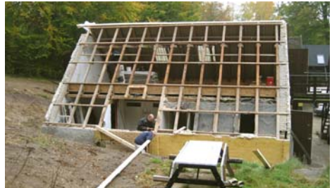
Bølgetaget er fjernet. Spærene genopbygges