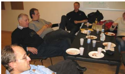
Der var hektisk aktivitet hele tiden