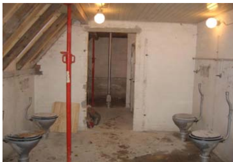
Nye vaske-/bruserum, hul hele vejen til Saunaen