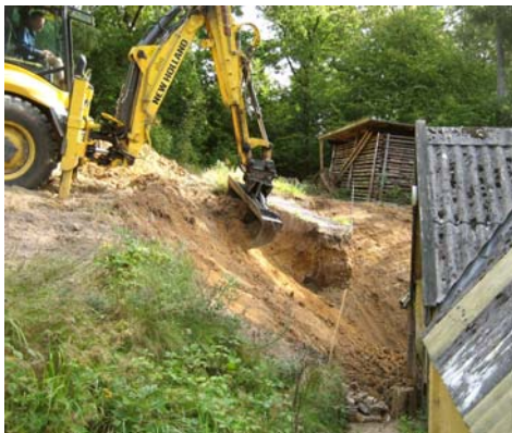
"Kælderen" var i vejen og måtte væk.