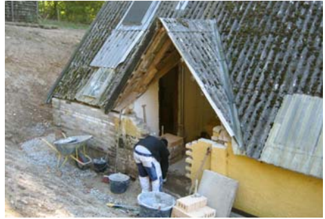
Lotteindgangen lige før den forsvandt

Medio oktober påbegyndtes nedtagning af det gamle tag på Barak 4. Den aldrig rigtig benyttede skorsten blev hugget ned, og indgangen til Lotte-lok----- blev lukket, ligesom den gamle nødudgang fra loftet via en loftslem med bro til bakken blev fjernet. I stedet er der nu ved det frilagte og delvis ommurede nordøsthjørne i østgavlen indsat en nødudgang og en ny dør til dametoiletterne, så adgangen dertil nu bliver mere attraktiv.