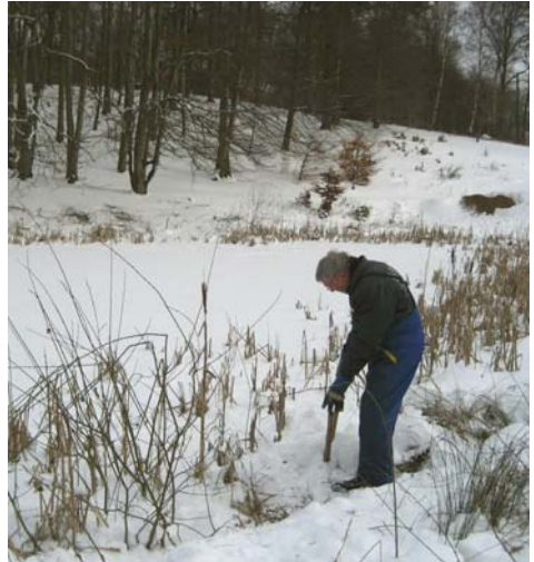
Arne i gang med næbbet ved iskanten.

Inspektion tidligere på vinteren har "afsløret", at der flere steder er træer, som er modne til beskæring af nedknækkede grene eller ligefrem til fældning, så der vil være arbejde nok også på grunden til en arbejdsweekend.