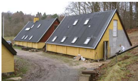
Taget er lagt med 12 vinduer

I skrivende stund (10. februar) er mureren ved at lægge fliser på gulvet i de nye toiletter og at hugge gulvet op i de gamle.