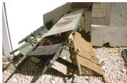
Bårene venter på rengøring, efter at de tilskadekomne er læsset ind på skadestuen.