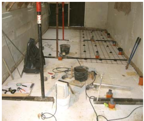
Gulvet er isoleret og næsten klar til støbning

Med udgangen af januar fjernede vi kabinevæggene omkring de gamle herretoiletter, og også kummer og installationer er stort set fjernet. For en sikkerheds skyld er de to dametoiletter dog stadig intakte, dels af hensyn til arbejdsstyrken og dels så vi har sikkerhed for at kunne åbne lejren ultimo marts. Blikkenslageren skulle dog gerne forinden have lagt rør til de nye toiletter.