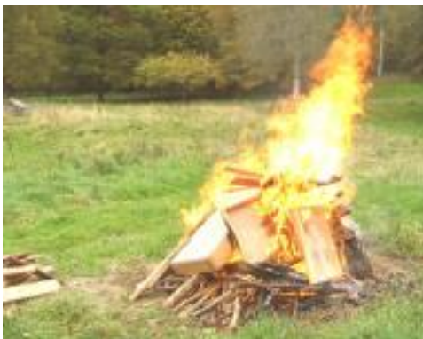
Gammelt træværk med borebiller brændes af