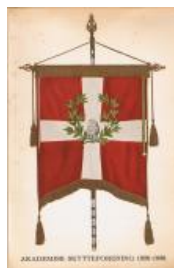
1936 AS & K 1926-36 kr. 75,-