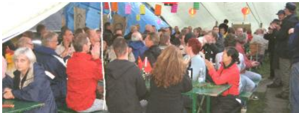
120 deltagere på gamle og nye bænke i haven