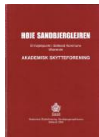
2002 Sandbjerglejren (fotobogen) kr. 180,-