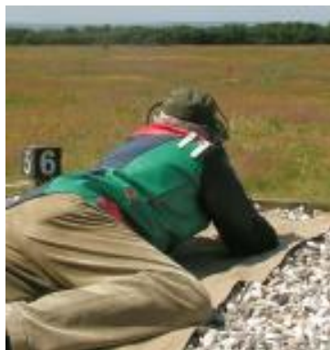
Svend Mørup Station