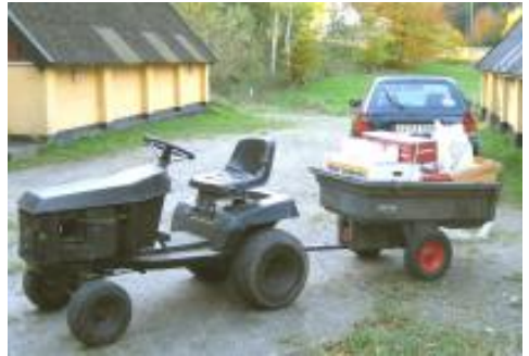
Første „flyttelæs“ til B5 18. oktober

må midlertidigt delvis opbevares i O-messen. Mange ting fra servicedepot og værktøjsdepot er dog frasorteret som unødvendige, og de sættes derfor til salg på et loppemarked, der afholdes i december (se annoncen på næste side).