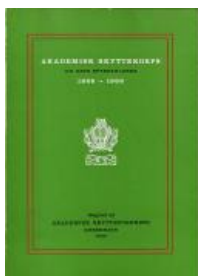
1966 ASK 1866-1966 kr. 10,-