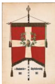
1911 AS 1861-1911 Udsolgt