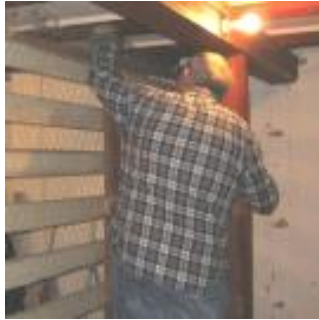
Arne fjerner hønset sammesteds