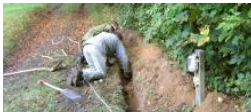
Her blev det hårdt