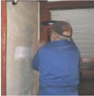
Popp skruer reol ned i værkøjsdepot