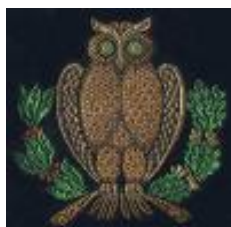
Stofmærke (50% størrelse) kr. 10,-