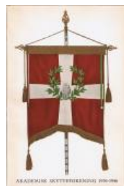
1946 AS & K 1936-46 kr. 75,-