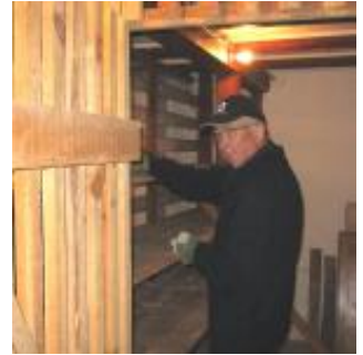
„Løp“ fjerner hylder i „Oles depot“