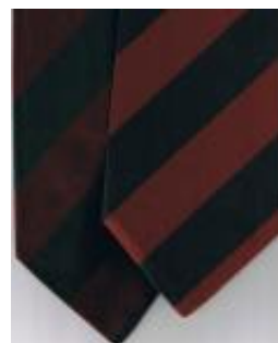
Slips (grønt / bordeaux) Polyester Silke

Sæt: Historiebøger (- 1911) kr. 350,- Sæt: Hist.bøger + Sandbjerglejren kr. 500,-