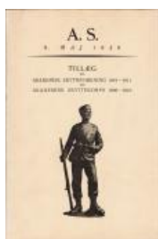
1926 AS & K 1911-26 kr. 100,-