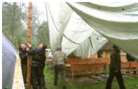
Kundens elever bygger spisetelt til 120 mand