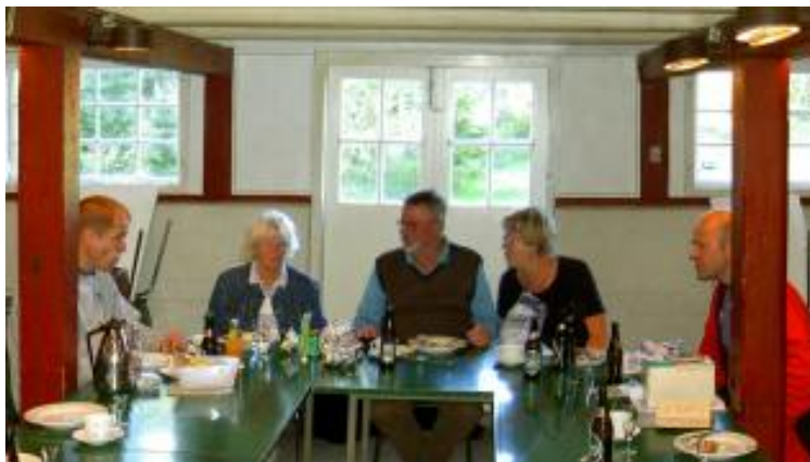
Bordenden med de alt for få deltagende i klubmesterskabet i O-biathlon: