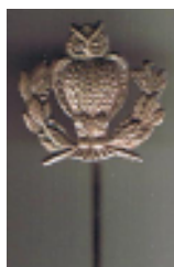
Nål (100% størrelse) kr. 50,-