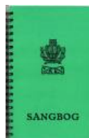
Sangbøger Spiralryg kr. 50,-