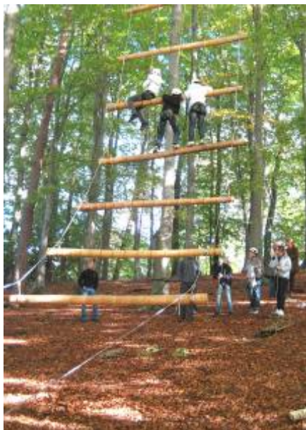
20 elever fra en 6' klasse i kæmpestigen

Et andet eksempel var en snes unge mennesker som vor kunde påtog sig at styre gennem nogle øvelser med en kæmpestige, der hænges op i de høje bøge i „Lokumslunden“, og et brobyggeri ved Raffts Navle, hvor de skulle anvende en gammel romersk konstruktion uden brug af søm el. lign. Broen holdes sammen af friktion og sejl garn. De havde en god dag, - og det har stort set alle deltagere i disse arrangementer.