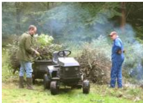
Også søndagens „høst“ måtte køres til bålet

Der blev løst væsentlige opgaver af de relativt få deltagere. Ros til dem. Andre forbigår vi i tavshed.