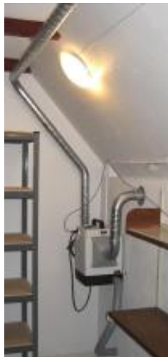
Affugteren er installeret i arkivet