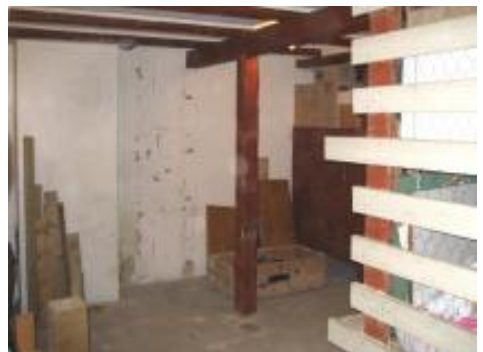
Rummet, hvor den nye ovn skal stå, åbner sig