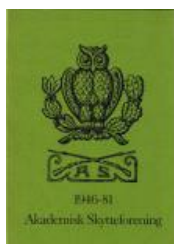
1981 AS 1946-81 kr. 50,-