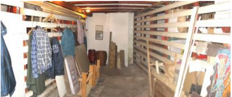
Depotgangen i Barak 1: Før rydning