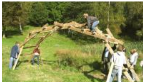
Romerbroen er bundet sammen med sejl garn