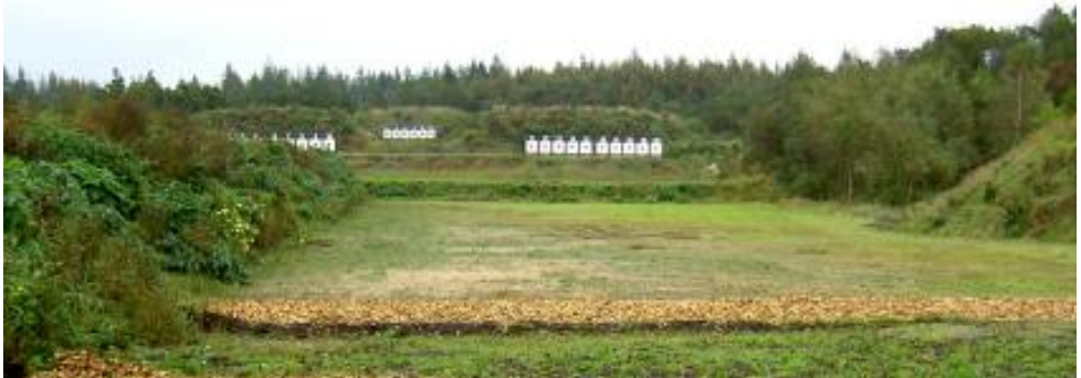
Ulfsborg Skyttecenters 200 og 300 m. bane (samme område som Feltsports DM i O-biathlon)