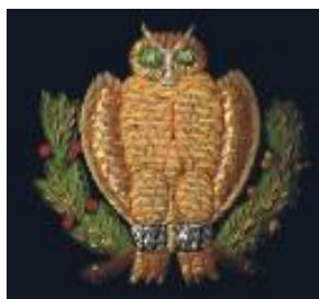
Blazermærke (kun få tilbage) (50% størrelse) kr. 150,-