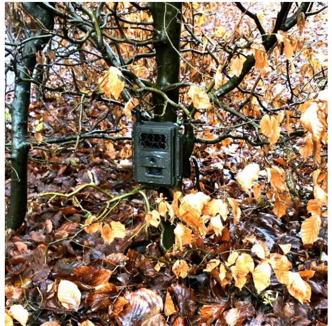
Et eksempel på et midlertidigt overvågningssystem anvendt på Høje Sandbjerg

Samlet set har det været vigtigt for bestyrelsen, at sikringsforanstaltningerne dels gør det vanskeligt for ubudne gæster at få adgang med køretøjer til området, og dels at adgangen for medlemmer og håndværkere ikke besværliggøres unødvendigt.