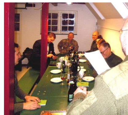
Efterspil i den yngre afdeling - "Holmensgade"