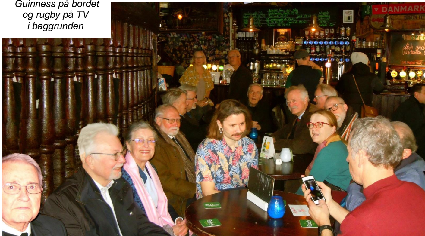
Der var trængsel i vores hjørne af The Dubliner