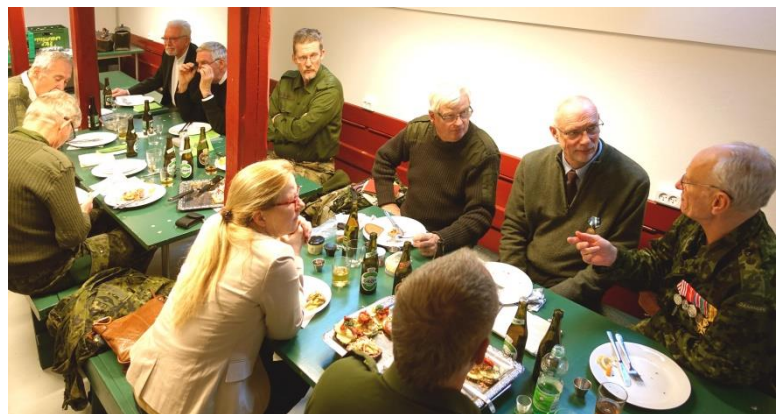
De lidt ældres bord