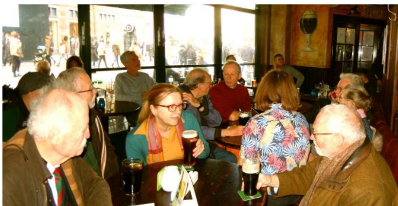
Guinness på bordet og rugby på TV i baggrunden