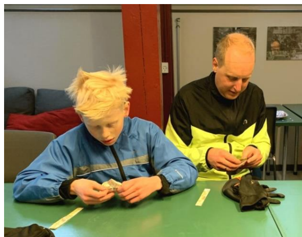
Vinderholdet fletter julehjerter

som lige før en post valgte at foretage en ruteoptimering, som bragte ham ud i en bundløs mose, hvor 3/4-dele af benklæderne efter denne rute var mørk som den dybeste brønd. De afgav dog et meget effektiv "lugtslør", som jeg blev udsat for og måtte ændre kurs mod posten.