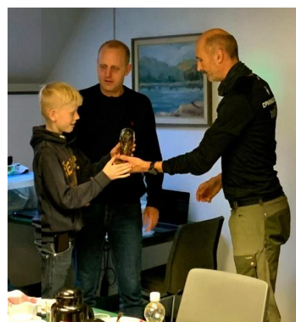
Præmien Francks Ugle overrækkes