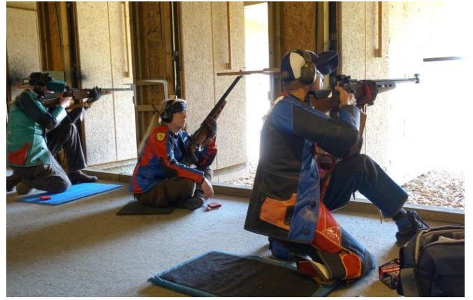
På Københavns Skyttecenter foregår feltskydningen også fra de overdækkede standpladser