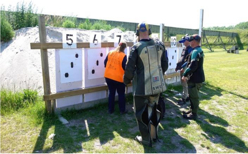
På 300 m banen var der oprettet en improviseret 100 m målgruppe.