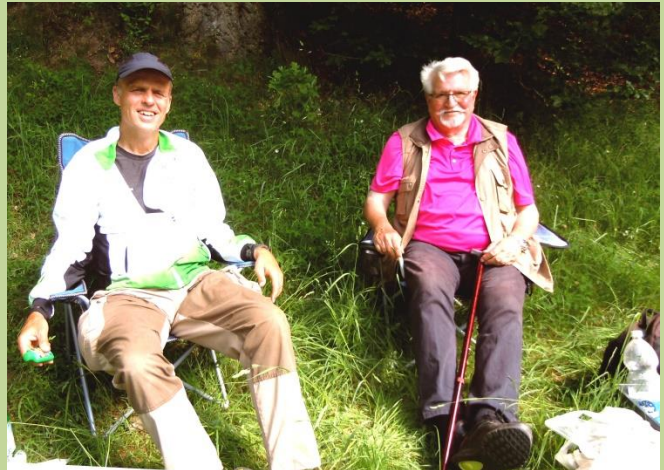
Her ses han slappe af oven på anstrengelserne sammen med AS holdleder felt-sport og myggene ved start/mål for O-løbet.