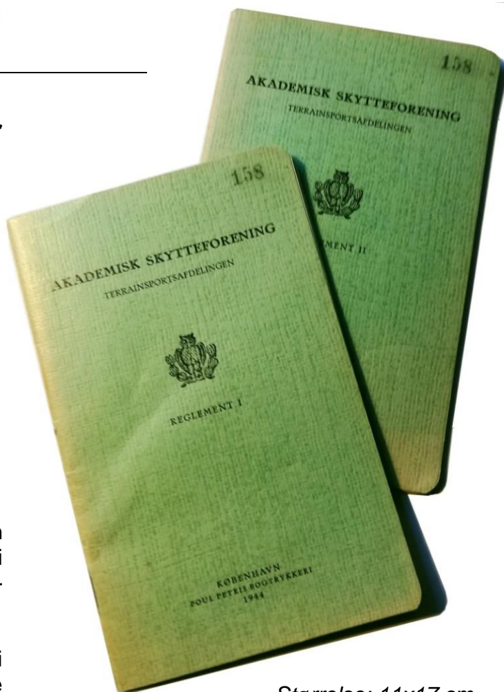
Størrelse: 11x17 cm

Tjenestereglementet (36 sider) er interessant læsning, som sammenlignet med datidens militære reglementer viser stort sammenfald, både med hensyn til indhold og formuleringer.