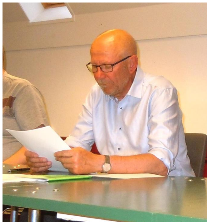
Afgående formand aflægger sin sidste beretning