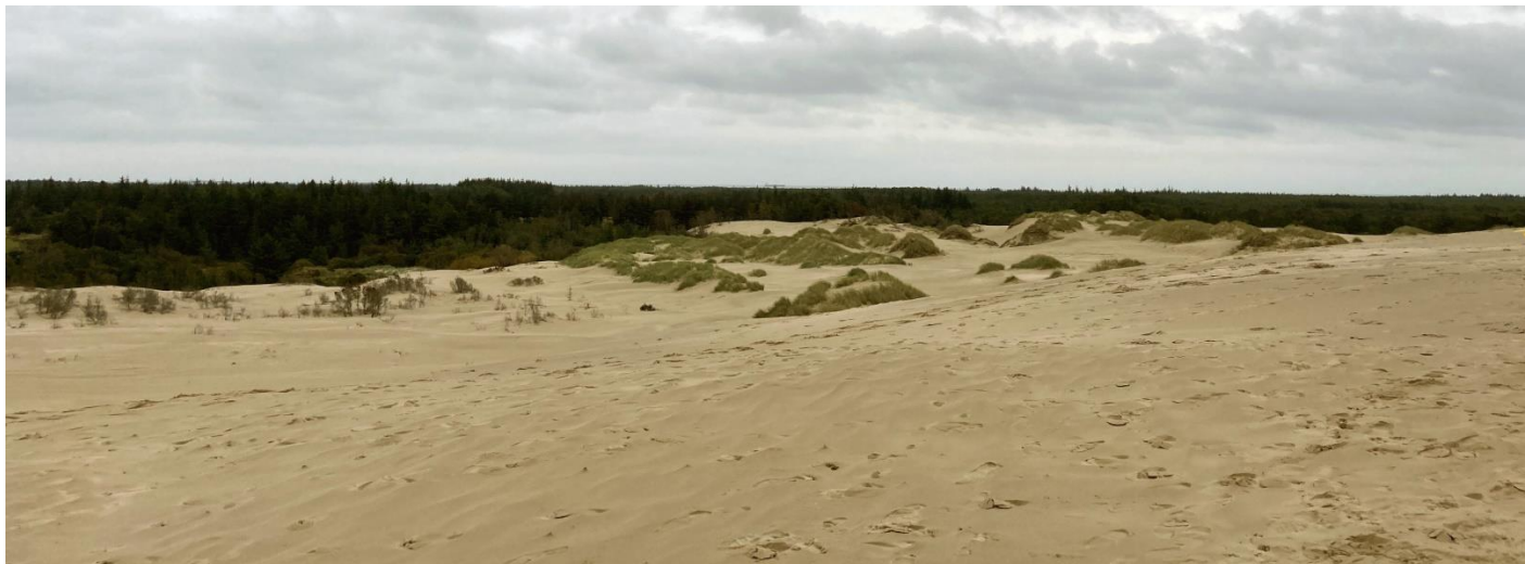
Kortlæsning fra Råbjerg Mile - det har ikke været nemt

Solen skinner fra en skyfri himmel - næsten i hvert fald - da de omtrent 60 deltagere i danmarksmesterskabet i feltsport samles godt 20 kilometer syd for Danmarks nordligste punkt mandag den 4. oktober. Det lover godt, og vejret er med os hele dagen gennem de 5 discipliner, som konkurrencen indeholder: pistolfeltskydning, håndgranatkast, afstandsbedømmelse, kortlæsning og orienteringsløb.