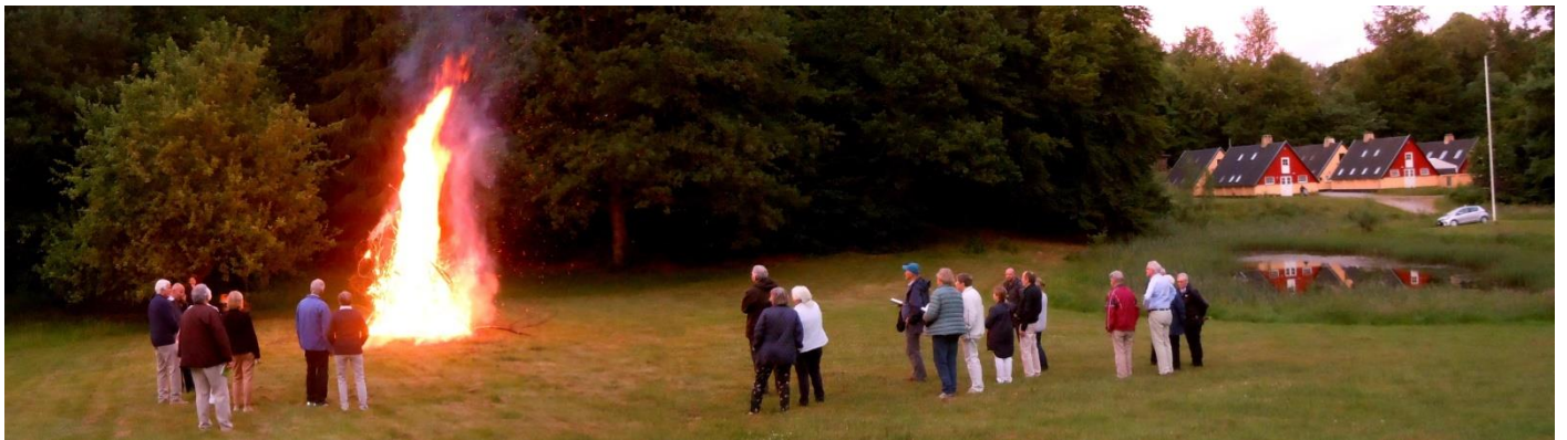
Referatets forfatter applauderer