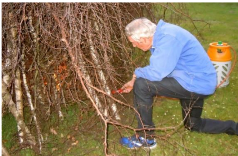
Sandbjerginspektøren gas-tænder bålet