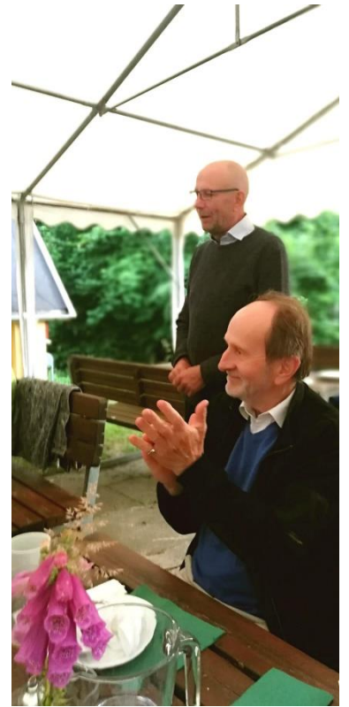
Høje Formand takker arrangørerne og kokken.