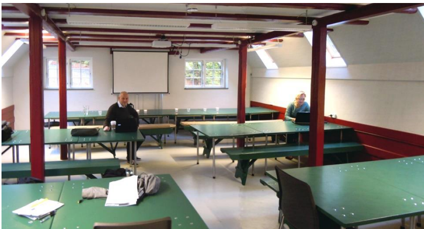
Lejere gør klar til undervisning på de nymalede borde