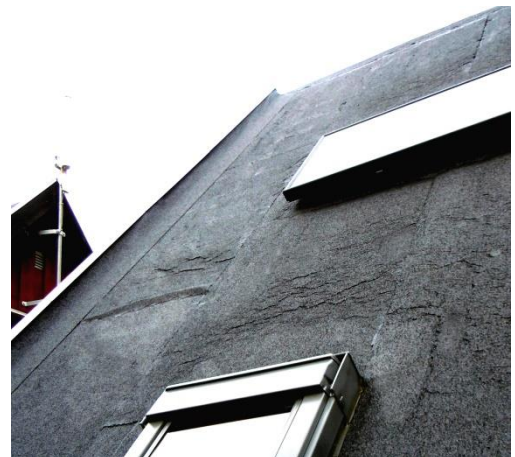
Tagpapskader på bygning 4