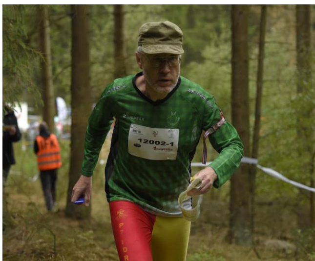
Kai på vej i skoven