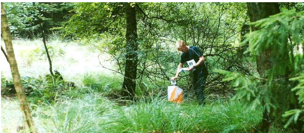
Post på orienteringsløbet i Kollerup klitplantage