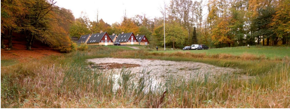
Bjerget i efterårsfarver og Søen med ekstraordinær lav vandstand

Efter den tørre sommer, som har udtørret øvelsesområdet, så der mangler mindst 1 meter vand i Søen, og så man kan gå over Rafts navle gennem dunhammerskoven, er der atter gang i inspektionens arbejde på Bjerget.