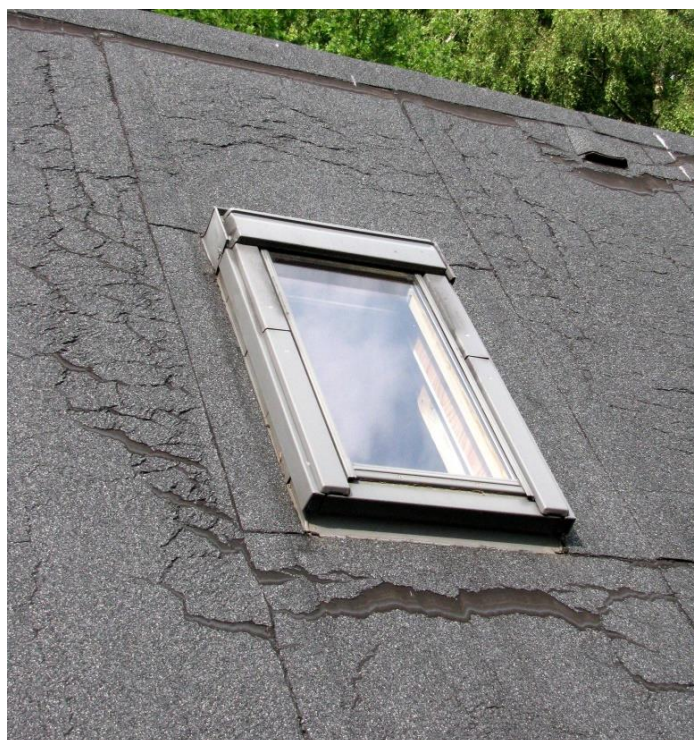
Taget på bygning 4

Hvorledes dette kommer til at berøre Sandbjerginspektionen er uklart, for vi har for mange år siden lavet vor egen drift- og plejeplan. Den rulles hvert femte år, og den sidste er benævnt 2016-26. Planen fastsætter de generelle retningslinjer for hvert delområde, skove, søer, enge osv. Hvor meget, en ny samlet plejeplan for hele fredningsområdet vil være i modstrid med vor egen plan, vil tiden vise. Men mon ikke det bliver et travlt efterår med hektiske mails, protester og skrivelser.