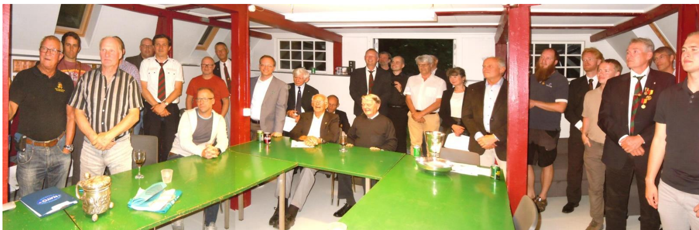
Nogle af tilskuerne til præmieoverrækkelsen