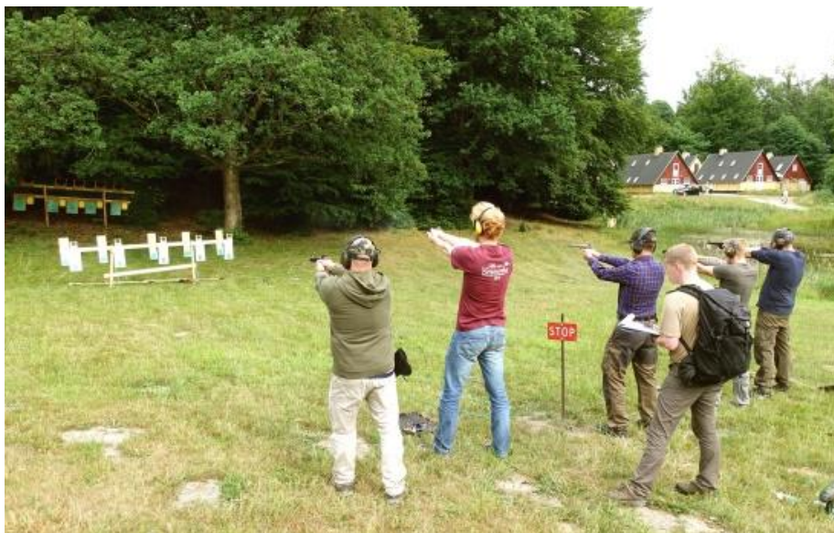
Feltskydning på Bjerget

Efter frokost, og fortsat foran tidsplanen, skyndte vi os til Høje Sandbjerg for at opstille terrænbanen og afvikle skydningen. Vi var velforberejdede. Hvor flaskehalsen nogle år har været antallet af batteriskruemaskiner til at skrue skiverne på skiveholderne, var vi i år veludrustede, idet flere af de rutinerede skytter havde taget med og i to tilfælde mere end en per mand.