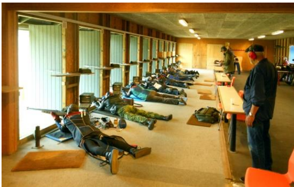
300 m banen

Bo ledede med fast hånd slaget ved baneskydningerne, og det skal han have en stor tak for.