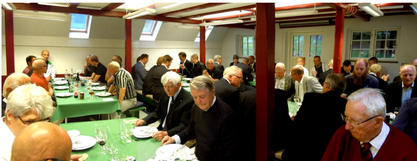
Middag om aftenen i mandskabsmessen på Høje Sandbjerg