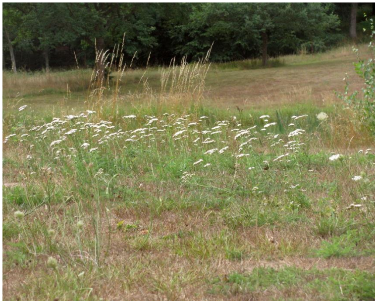
Ukrudt på trekanten