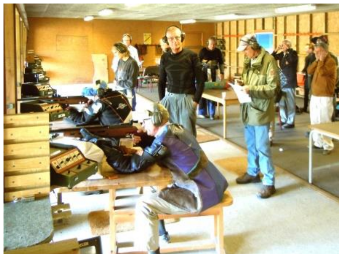
Formandsskydningen, som Høje Formand vandt. Det var den eneste danske gevær-sejr.