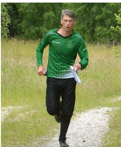
Referenten på vej i mål

Heldigvis var energiniveauet - i hvert fald ved start - højt hos alle deltagere takket være muligheden for selv at lave den perfekte madpakke! Undertegnede kunne dog konstatere, at energiniveauet faldt en del i løbet af de 7 km orienteringsløb rundt i skoven, som ifølge GPS-uret blev til 8,3 km i alt.