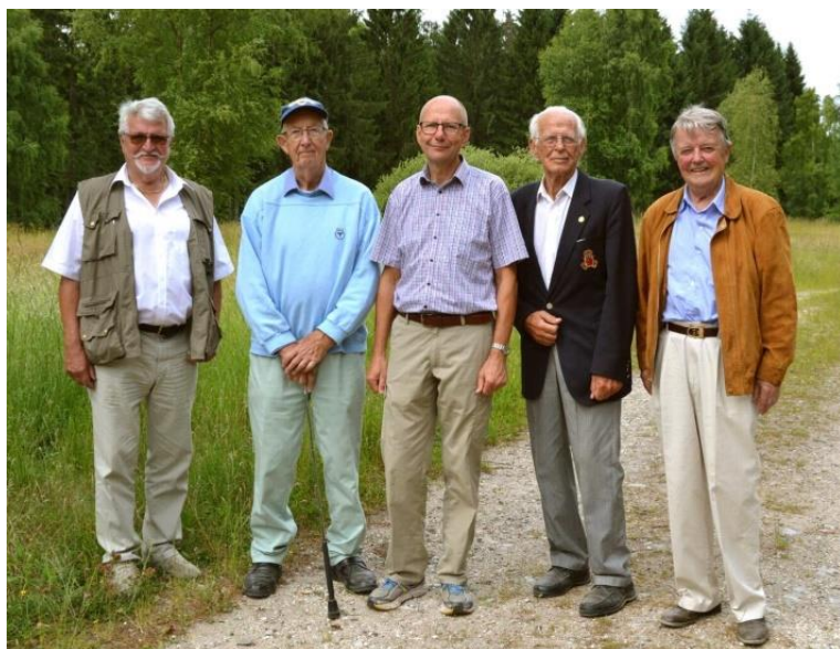
VIP-gruppen på tilskuerpladserne på 200 m banen og ved start/mål O-løb