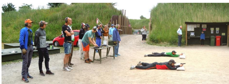
Skydning på Kalvebod