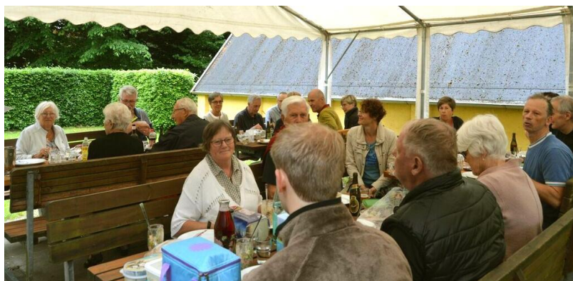
Frokost i teltet i haven

Vi havde fantastisk vejr i skoven og først på eftermiddagen. Men det var godt, at vi havde teltet. Hen på frokosten begyndte det at regne - vist nok den første regnbyge, vi fik i maj 2018.