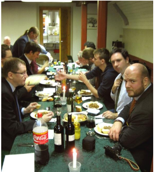
Middag lørdag aften på Bjerget