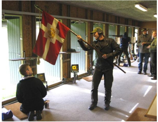
AS Århus holdt fanen højt