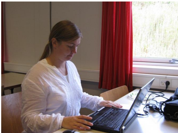
Betina har styr på resultaterne