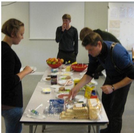
Frokost i SKAK-huset