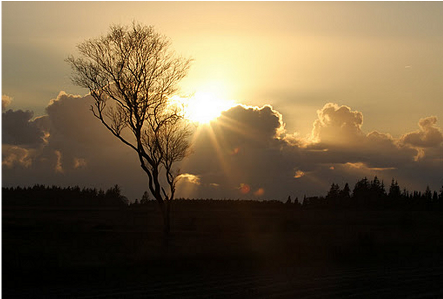
Solopgang over Borris Sønderland