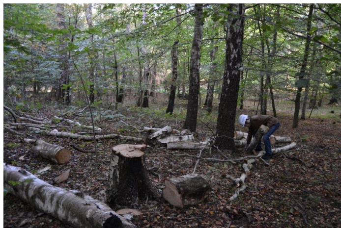
Opskæring af birk