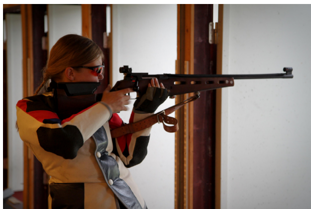
200 m - Betina

Som følge af udskydelsen af riffelskydningen var tidsplanen skredet, og de københavnske skytter måtte derfor desværre forlade Løvenskioldsbanen før præmieoverrækkelsen for at nå færgen tilbage til København. Der gik dog ikke længe før weekendens samlede resultater også nåede ud til Oslo-båden, og til stor glæde for alle havde ASK vundet holdkonkurrencen på riffel, ligesom nederlaget til århusianerne i pistolkonkurrencen kun blev afgjort af sølle 6 points.