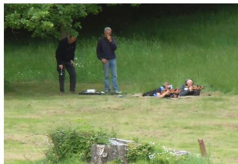
- - - mens andre holdt skydetræning