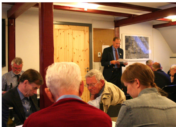
Kassereren gennemgår regnskabet