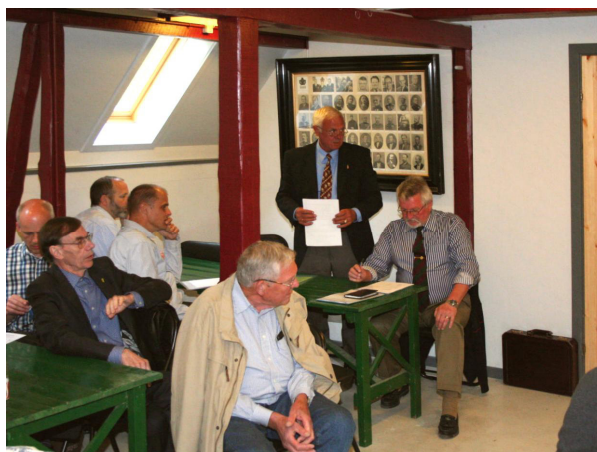
Dirigenten overtager kommandoen

Disse fordelte sig på sektionerne således (idet nogle er noteret med tilknytning til flere sektioner):