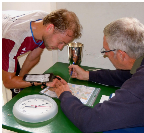
Den senere vinder og banelæggeren drøfter banen og vejvalget

Efter løbet, men før frokosten, blev der også tid til træning i skydning med biathlon-geværer.