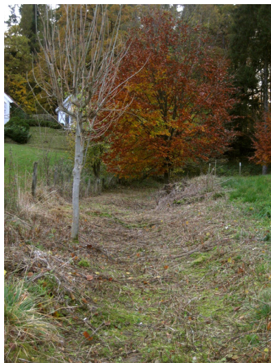
Det ryddede skel ved Cykelskuret