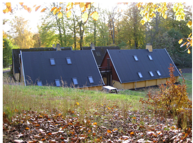
Lejren som den nu ser ud fra nordøst