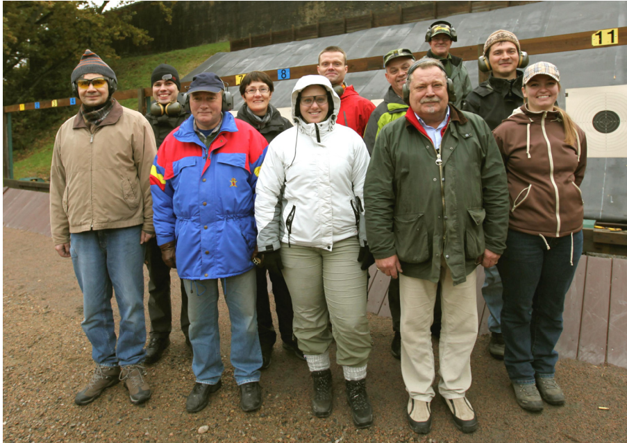
Pistolholdene på pistolbanen på Revingehed