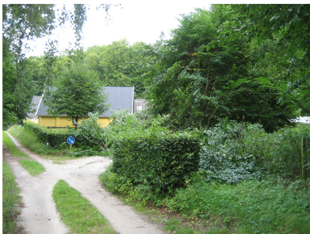
Vejene som de så ud fra syd "før"