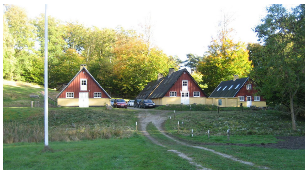
Lejren med det ryddede forterræn