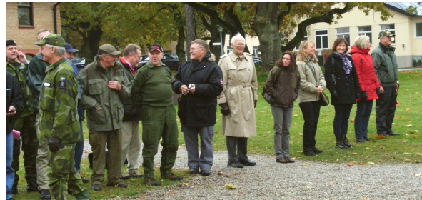
De fleste af de danske deltagere og nogle af de svenske.