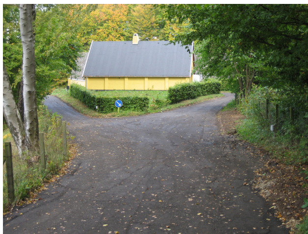
Vejene med ny belægning og mere plads