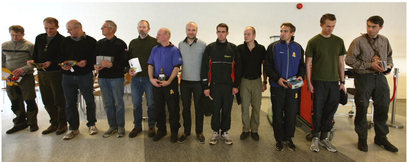
Feltsportsdeltagerne til præmieoverrækkelsen - i placeringsorden fra højre