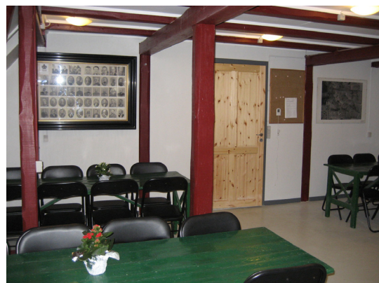
D-messen fra indgangen og modsat

Skønt det absolut ikke var hensigten "sneg" Birger Hoff sig til udenfor programmet at sige nogle meget anerkendende ord om forløbet.