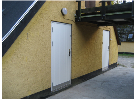
Vestgavlen af B4 med nye døre.