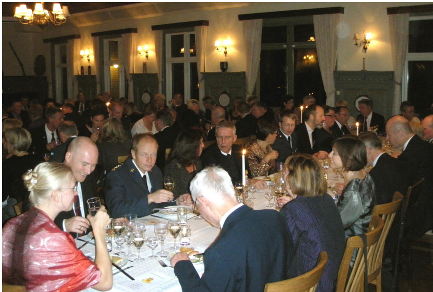
Festmiddagen i officersmessen