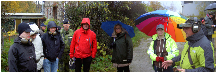
Feltskydning pistol i Hardeberga Stenbrott