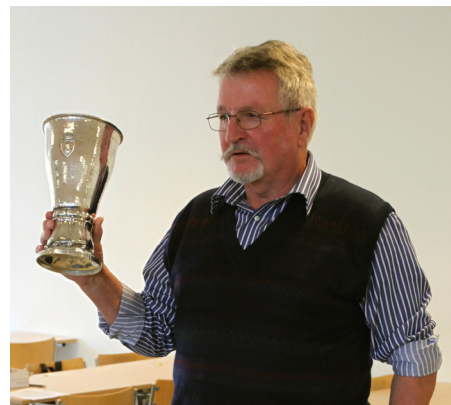
Høje Formand med Schwartzkopf- pokalen. Den blev udsat allerede til den første skydning i 1920 og vundet til ejendom af AS, som genudsatte ved 60 års jubilæet i 1980 som evigt vandrende hold- præmie for feltskydning.

Officersmessen på Revingehed ned dansk og svensk flag