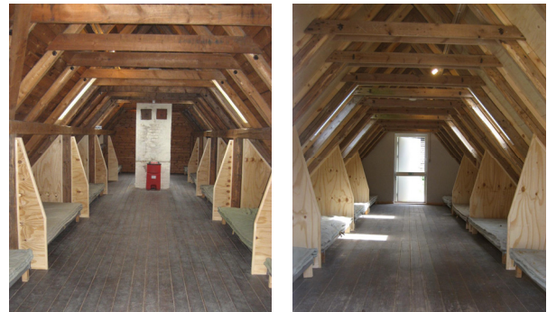
De nyindrettede lofter i Barak 1 og 4