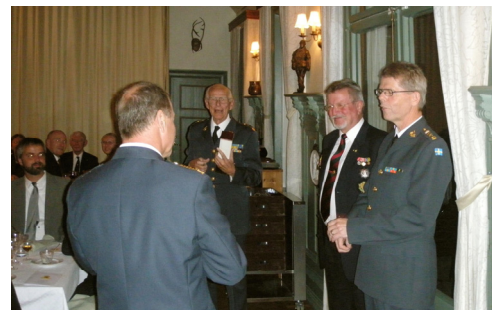
og præmieoverrækkelse til samme