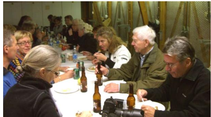
VIP og ledsager-frokost på skydebanen