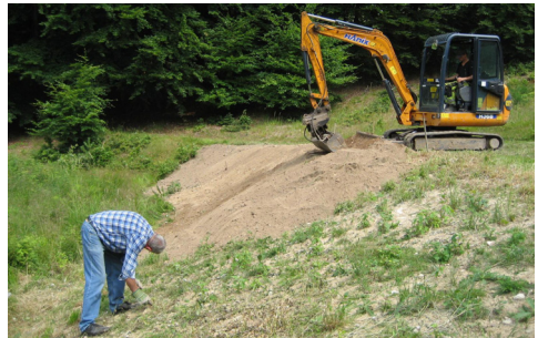
Skråningen NV for bygningerne under regulering