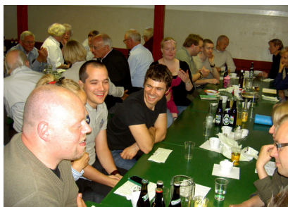
--- og god stemning ved middagen