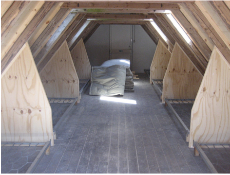
Loft 4 med nymonterede skillevægge og senge (vist uden madrasser)

plads i stedet. I forbindelse med gulvets færdiggørelse løb vi ind i et problem med mikrorevner i afretningslaget, som vil forsinke færdiggørelsen af rummet.