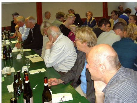
Sankt Hans aften