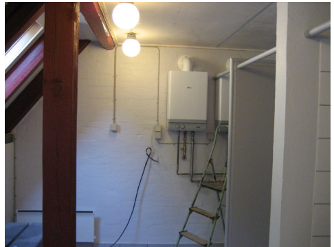
To gasvandvarmere bagest i bruserummet

Siden det seneste blad udkom er VVS arbejdet i bade/bruse- afdelingen afsluttet med installation af to gasvandvarmere, der hver betjener to bruser. De tænder automatisk ved åbning af en varmtvandshane og de har hver deres gasforsyning, og der er dermed god sikkerhed for at noget fungerer selv i tilfælde af en tømt beholder. De 7 store håndvaske (5 i vaskeafdelingen og 1 i hvert af toiletområderne) forsynes fra en 15 l el-vandvarmer, der bør være tændt, når lejren er i brug.