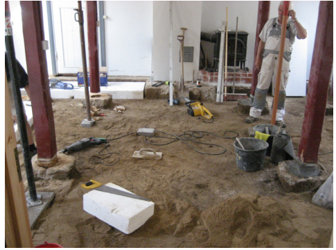
D-messen med frilagte søjleender før støbning

Den færdige skråning ved B1 set fra P-pladsen