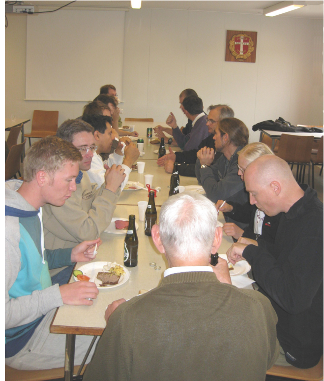
Frokosten lørdag i SKAK-huset