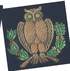
Stofmærke 10 kr.