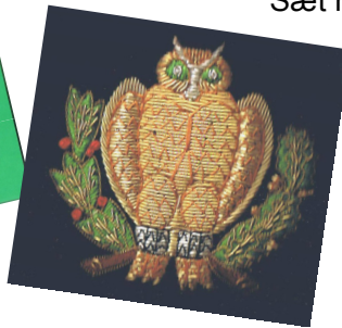
Blazermærke 150 kr.