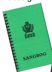
Sangbog 50 kr.