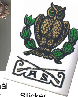
Sticker Kan afhentes gratis