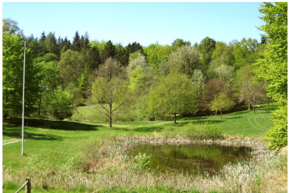
Majudsigt fra "hylden"