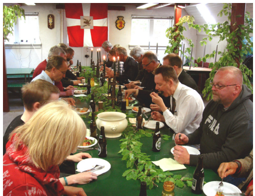
Spisning i undermessen, som i dagens anledning var udsmykket med friske bøgegrøene og faner.