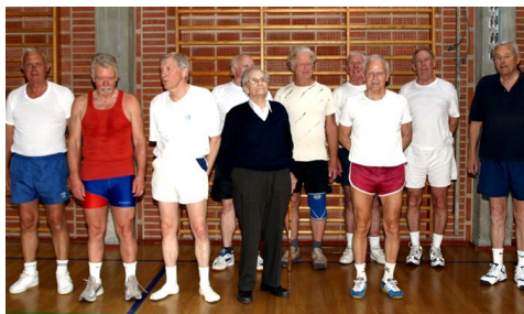
Først i salen - - - - - og derefter på Bjerget