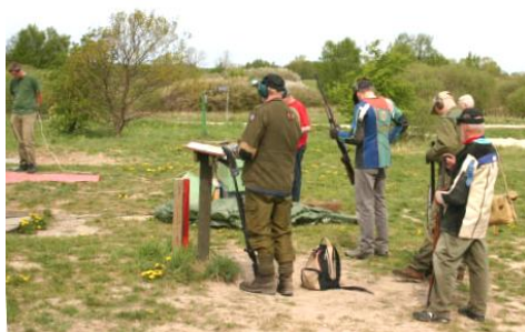
Seniorholdet ved sekundskydning