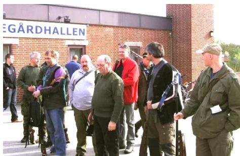
Seniorholdet klar til afgang

stande med dertil hørende forskellige antal træffere. Derefter blev der råbt lidt højere under de 2 minutters klargøring og det gennemsnitlige antal træffere steg.