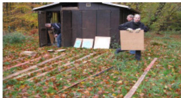
Forhåbentlig sidste gang, vi bruger det system

Efter skydning og oprydning var vejret så godt, at vi spiste udenfor på bakken nord for barak 1-2 og kunne nyde udsigten ud over dammen.