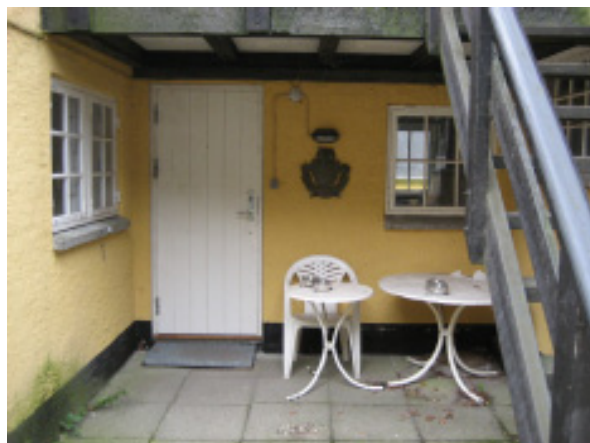
Fremdraget fra gemmerne: Foreningens bomærke er nu sat op på Høje Sandbjerg