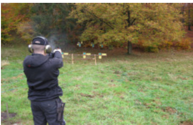
Bruger han mon sortkrudt ?

Vejret vist sig fra den bedste side årstiden taget i betragtning med lidt skyer og solstrejf uden regn og temperaturer, der var over gennemsnittet.