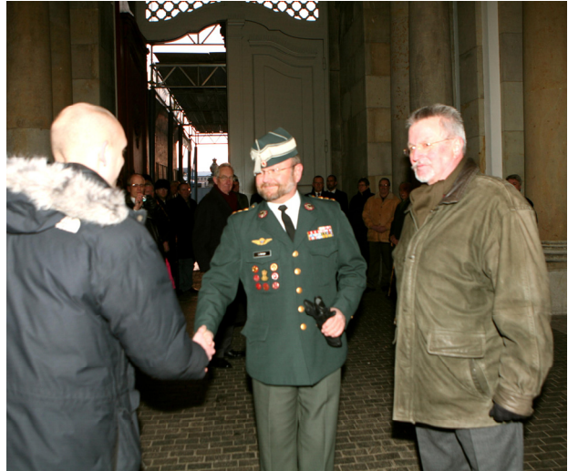
Æresgæsten hilser på „Ledende Senior“ for Studenterforeningen.