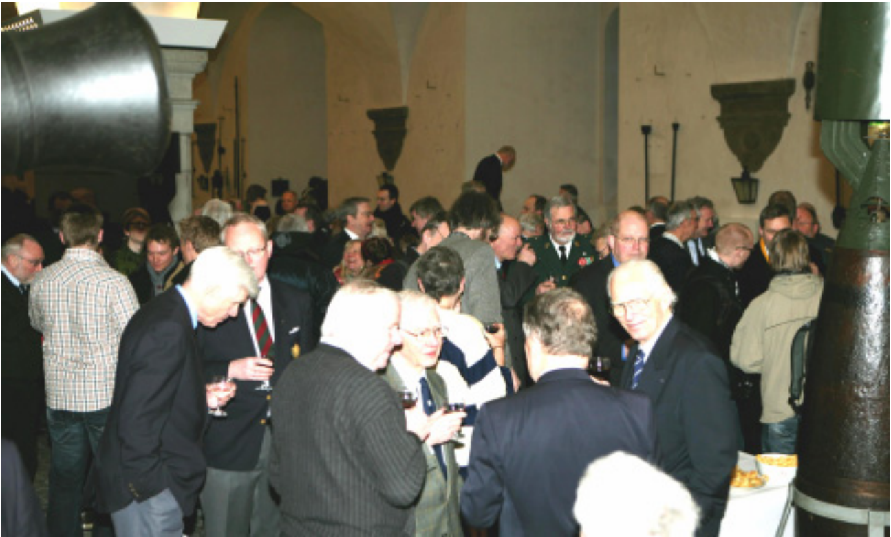
Receptionen i Kanonhallen på Tøjhusmuseet.