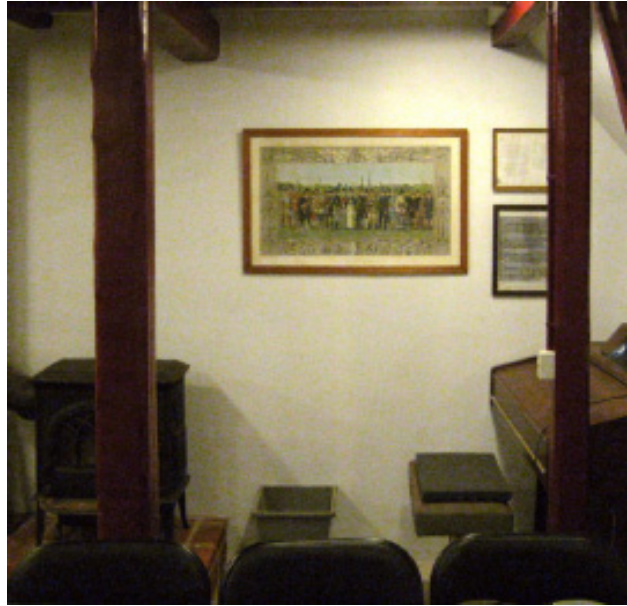
Hartmanns gave i D-messen

Udvidelsen af vore kabelanlæg til vort overvågningsanlæg er fulgt op med dokumentation af alle tracéer og samleboxe. Efterfølgende