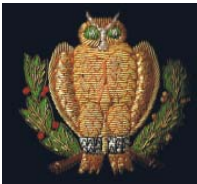
Blazermærke (kun få tilbage) og stofmærke (begge: 50% størrelse) kr. 150,-