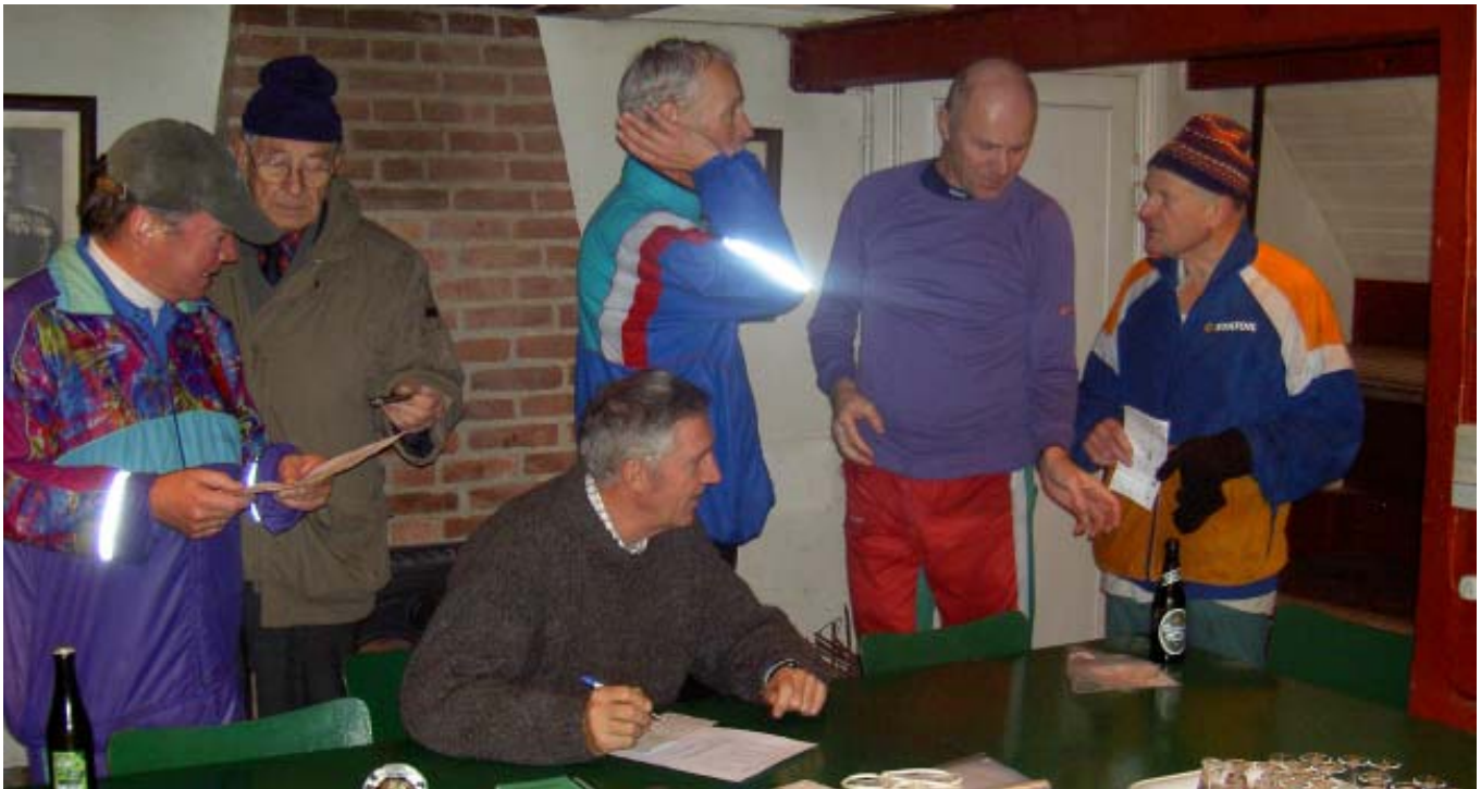
Aktivitet ved målet i undermessen