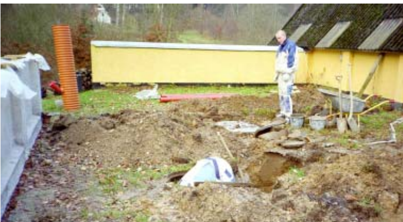
Tagvandsledninger til B 2 og B 3