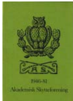
1981 AS 1946-81 kr. 50,-