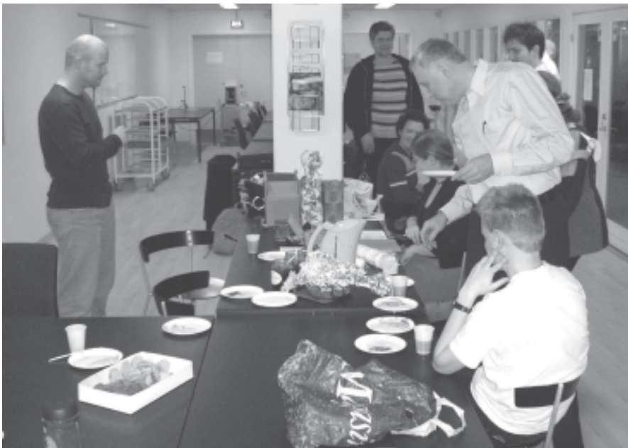
Nogle skytter mæsker sig, mens andre skyder.