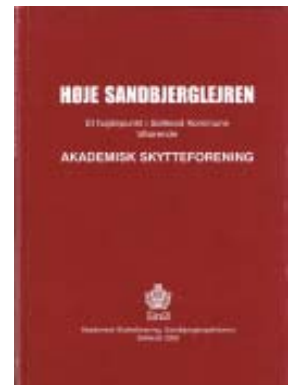
2002 Sandbjerglejren (fotobogen) kr. 180,-