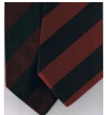
Slips (grønt / bordeaux) Polyester Silke Begge udsolgt

Sæt: Historiebøger (- 1911) kr. 350,- Sæt: Hist.bøger + Sandbjerglejren kr. 500,-