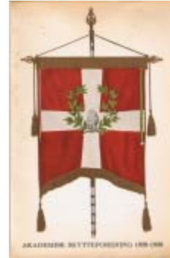
1936 AS & K 1926-36 kr. 75,-