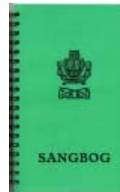
Spiralryg kr. 50,-