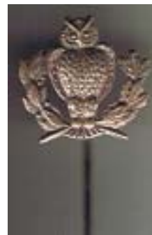
Nål (100% størrelse) kr. 50,-