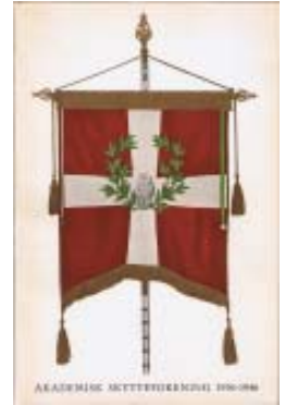
1946 AS & K 1936-46 kr. 75,-