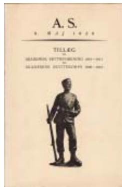
1926 AS & K 1911-26 kr. 100,-