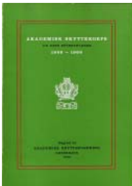
1966 ASK 1866-1966 kr. 10,-