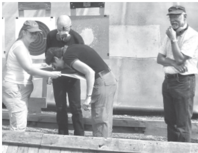
Lagledarne dørner, mens skytten venter på resultatet.