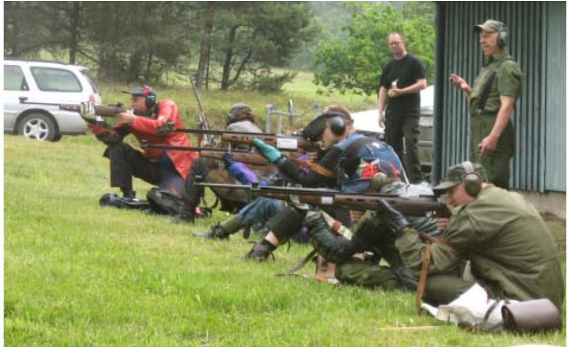
Feltskydning på bane