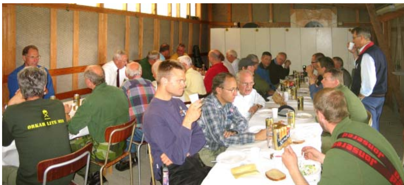
Frokost på skydebanen