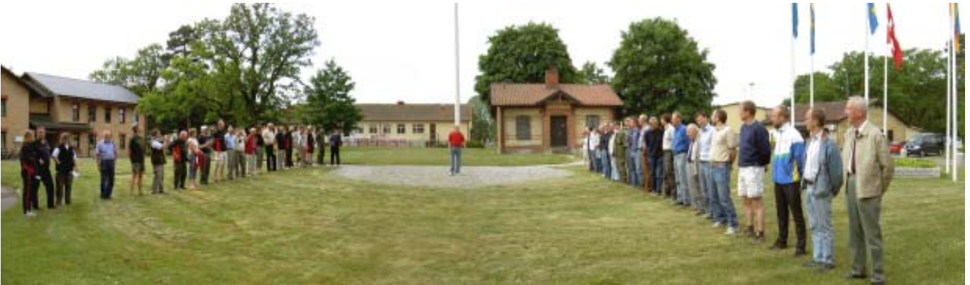
Holdene opstillet til velkomst foran hovedvægten