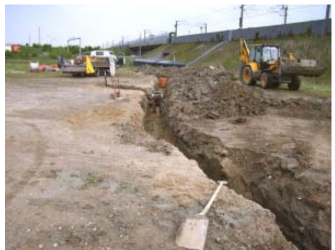
19. maj: Gravearbejder, nedlægning af kabler til vand, el og kloak.