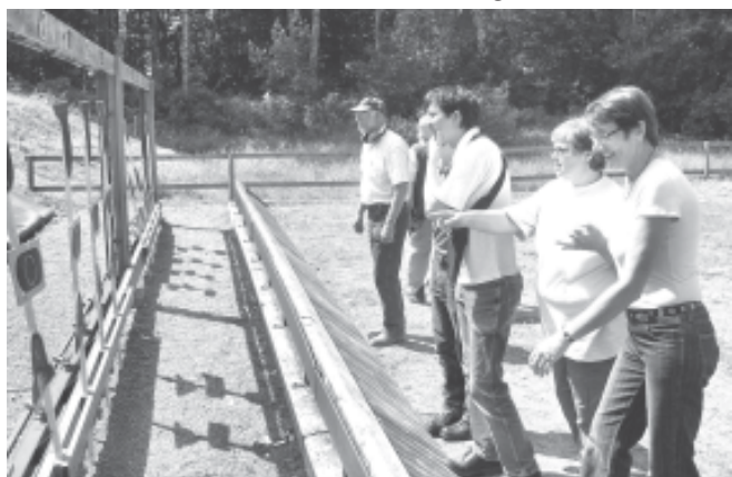
Har vi ramt?