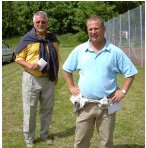
Høje Formand og Översten efter vel gennemført punktorientering

Søndag morgen gennemførte vi pistolskydningen, som yderligere cementerede stillingen, og sluttede med håndgranatkast efter tillempede militær femkampsregler, helt anderledes end vi er vant til. Men vort unge hold klarede også denne disciplin med overbevisning.