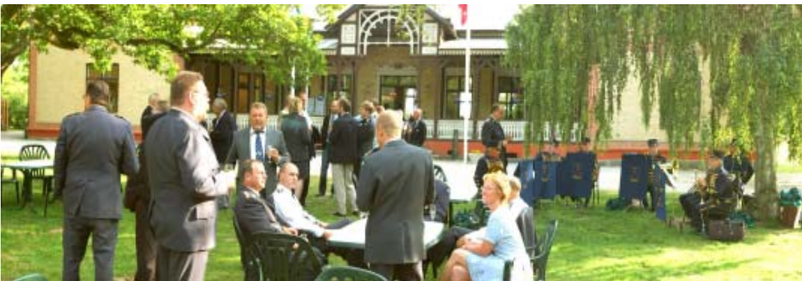
Lørdag aften: Samling og champagne foran officersmessen før middagen

Om aftenen var der fin middag i officersmessen, dog var det lidt skuffende, at den „gamle tradition“ med stående sild, øl og snaps, før man går over til siddende hoverret og rødvin, ikke var på programmet i år.