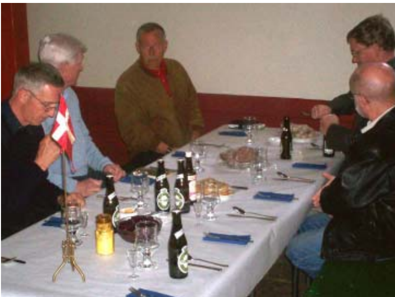
Venter på gule ærter