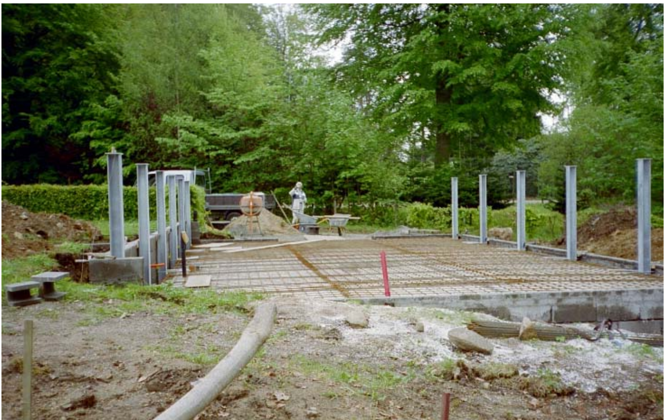
B5 klar til støbning af gulv. Søjlerne er rejst, og gulvplacering i forhold til terrain ses tydeligt