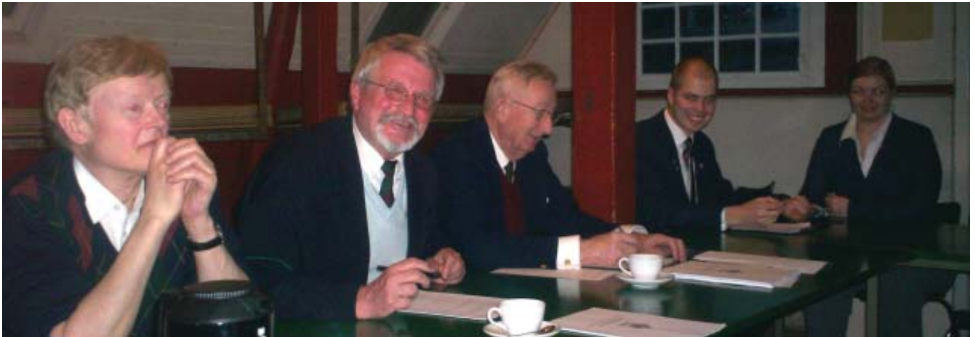
Der vedtages ølpause.