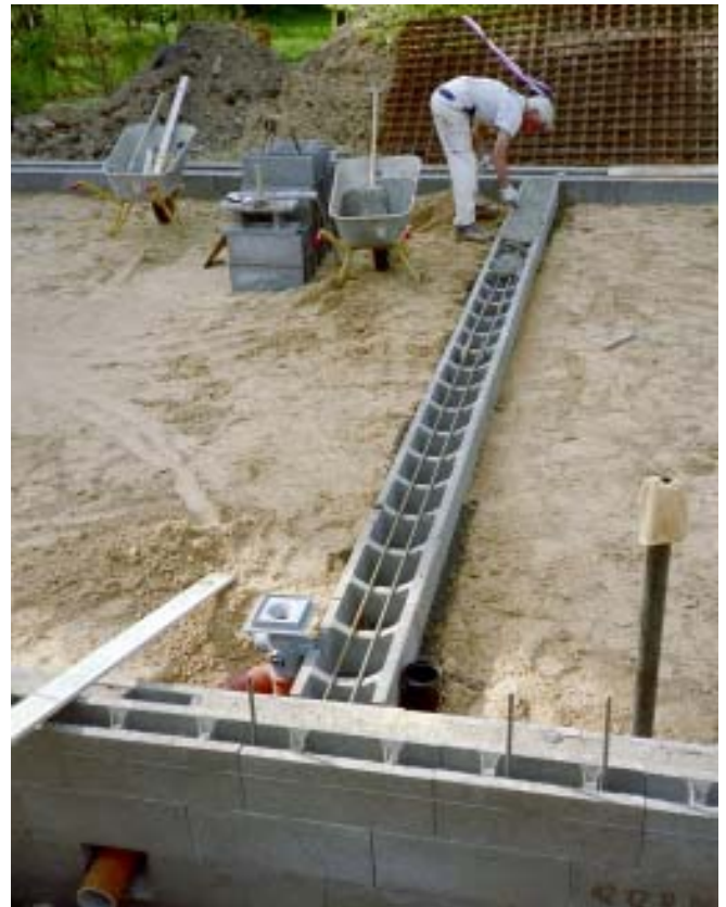
Indre vægge kræver knap så dybe fundamenter. Her er hovedskillevæggen med ilagt jern.

Den forventede videre fremdrift er, at mureren skal føre murene op til „nedre hanebånd“, hvorefter de dækkes af med pap, indtil der kan indgås aftale med en tømrer om spær og vestgavl mv. Da der endnu er visse konstruktionsdetaljer som skal afklares, er der ikke indhentet priser på disse arbejder, ligesom finansieringen også først for nylig er begyndt at falde på plads. Håbet er, at bygningen kan komme under tag inden vinter, men maling og andre arbejder nåes nok ikke. Ibrugtagning forventes derfor først til næste år.